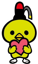
やかげ観光大使 やかっしゅ

ナースの仕事を実践しながらに体験できるブースをご用意し、岡山県看護協会が懇切丁寧に助言・アドバイスします